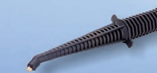
Dampfpflanze July schwarz Professional TH12733