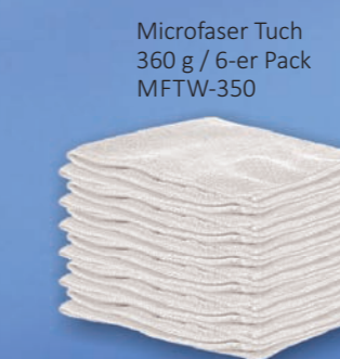
Microfaser Tuch 360 g / 6-er Pack MFTW-350