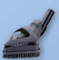
Dreieckige Bürste 120500V1