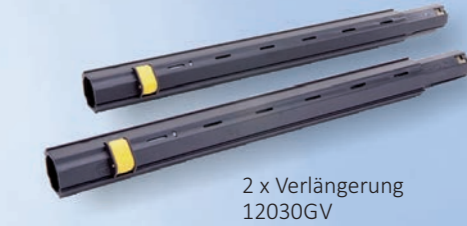
2 x Verlängerung 12030GV