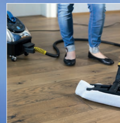
THERMOSTAR® verwendet nur hochwertiges und langlebiges Zubehörmaterial.