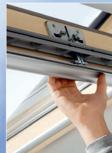
Mit dem Trockendampf von THERMOSTAR® lassen sich Schmutz und Keime in vielen unzugänglichen Bereichen effektiv entfernen.