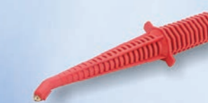
Dampfpflanze July rot Professional TH12743