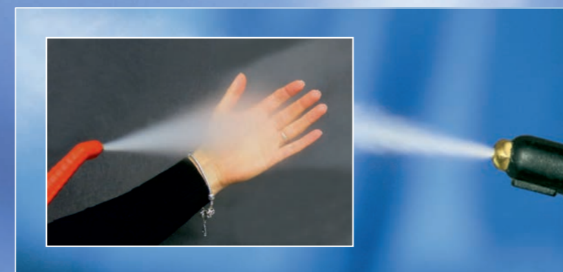
Der THERMOSTAR® erzeugt Hochqualitäts-Trockendampf mit ca. 180 °C und 8 bar Druck