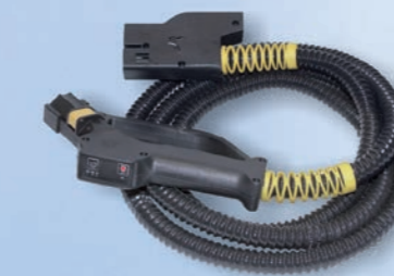
Dampfschlauch July 8 bar Professional Code: JD03A0F