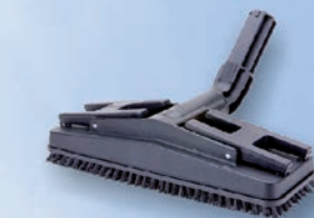
Rechteckige Bürste 120400V1